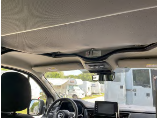
Dach kann aufgestellt werden