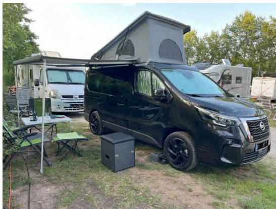
Die Liegefläche beträgt oben ca. 1,15 m und ist für maximal 2 Personen mit insgesamt 160 Kg geeignet.