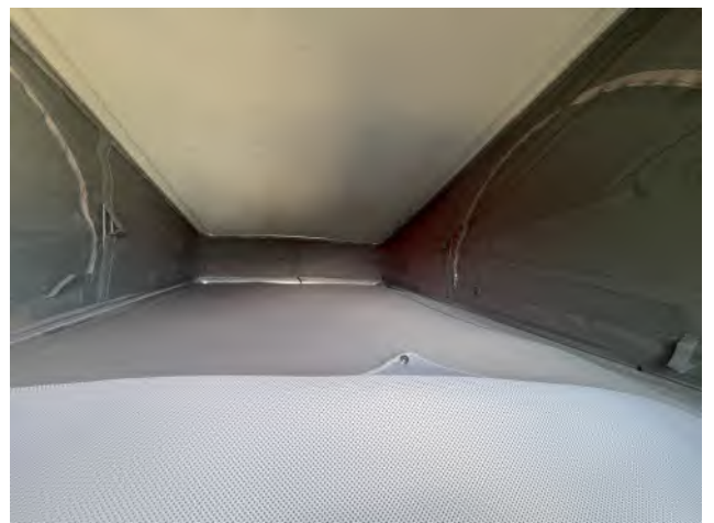
2 Nachtschlampen plus USB-Anschluss zum Handy laden im Dachbett.